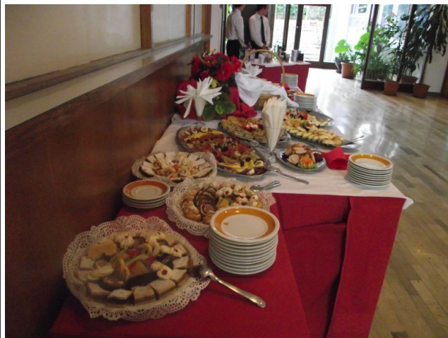
ponuda na visini

Posjeta nije bila previše brojna ali je zato atmosfera bila jako dobra, za što moram zahvaliti svima koji su došli, a posebna zahvala ide svima u Ugostiteljskoj školi koji su pokazali da sva priznanja koja redovno osvajaju nisu bez pokrivača.